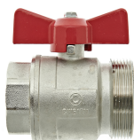
Арт. 50501 Шаровой клапан 2" 1 1/2" ВР x 2" НР, плоская прокладка