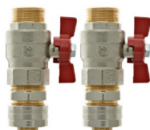
С запорными клапанами