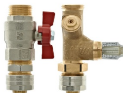
С запорным и балансировочным клапанами